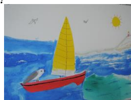
Carte relief encre