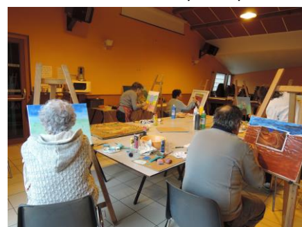
Concentration des participants