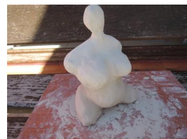
A la manière de Nicky St Phalle